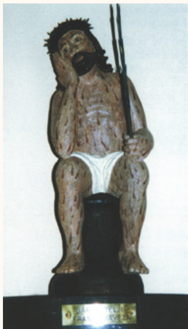
Kip Isusa Krista pod nazivom „Božja misel“