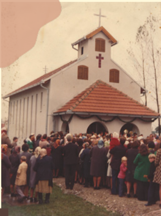
Kapela prilikom blagoslova 13.10.1974.