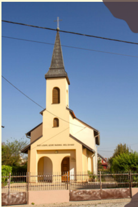
Kapela danas, poslije 50. godina