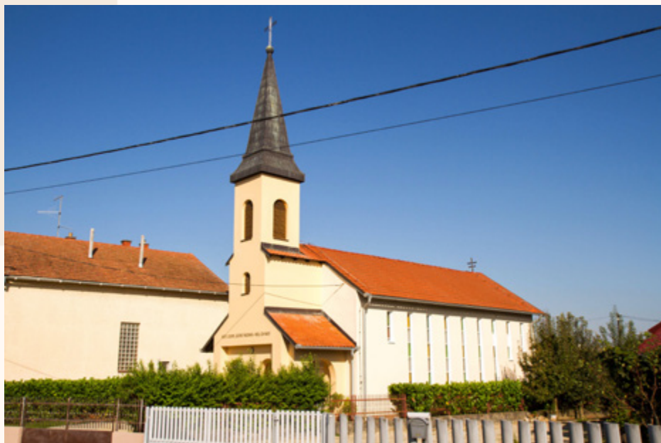
Vanjski izgled kapele danas – s bočne strane