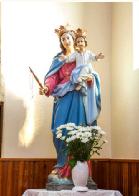
Obnovljeni kip Majke Božje