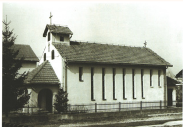
Kapela sv. Josipa radnika 1974. godine