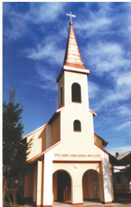
Kapela nakon proširenja 1996. godine