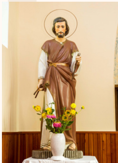
Obnovljeni kip sv. Josipa radnika