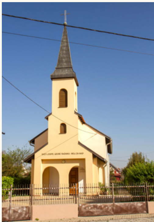
Današnji izgled kapele s prednje strane