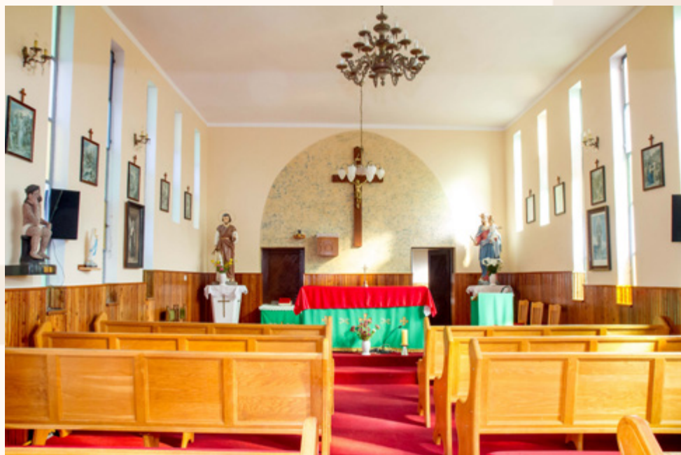
Unutrašnjost kapele danas